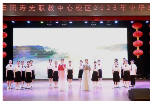
图 5 校园文化活动