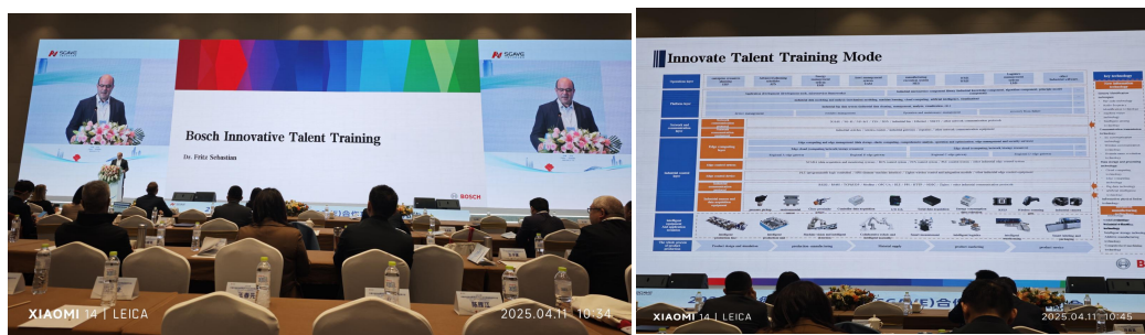
图 6 学校教师参加《中德先进职业教育 (SGAVE) 合作项目 2025 年院校研讨会》

加强教师国际交流培训，提升教师国际视野。2024 年 9 月，1 名教师参加中俄国际教育高中（中职）学校创新发展联盟会议。2024 年 9 月，5 名骨干教师参加赫尔曼·西蒙学院隐形冠军峰会；2024 年 10 月，学校农艺专业教师参加第六届中荷都市农业学术研讨会，会议展示了中荷两国在农业专业职业教育领域的优势和创新，交流了双方在教学管理、课程开发、实践教学等方面的创新成果和应用。