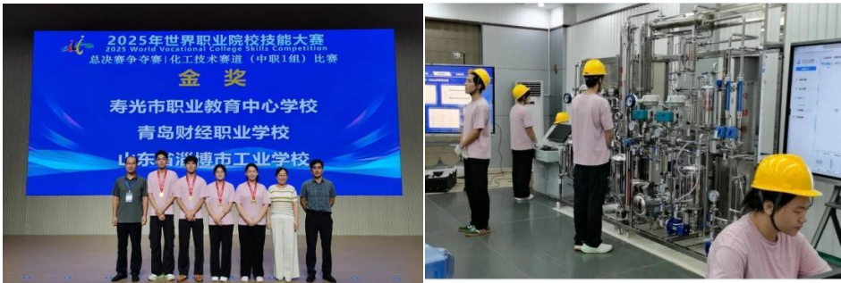
图 12 世界职业院校技能大赛照片

近年来，学校始终坚持以赛促教、以赛促学，构建了系统化的竞赛培养机制，积极为学生成长成才搭建广阔平台。下一步，学校将以大赛为契机，进一步推动专业建设与产业需求对接，努力培养更多高素质技术技能人才，为服务区域经济发展注入更强劲的职教力量。