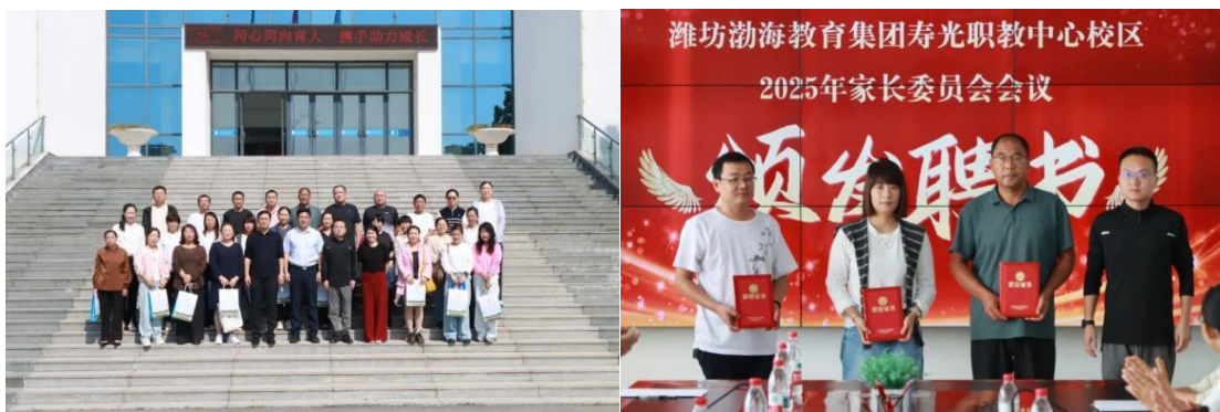
图 2 学校家委会照片

教育是一场双向奔赴的旅程。下步，学校将继续以“家校同心”为笔，以“共育成长”为墨，书写新时代教育协同发展的新篇章。