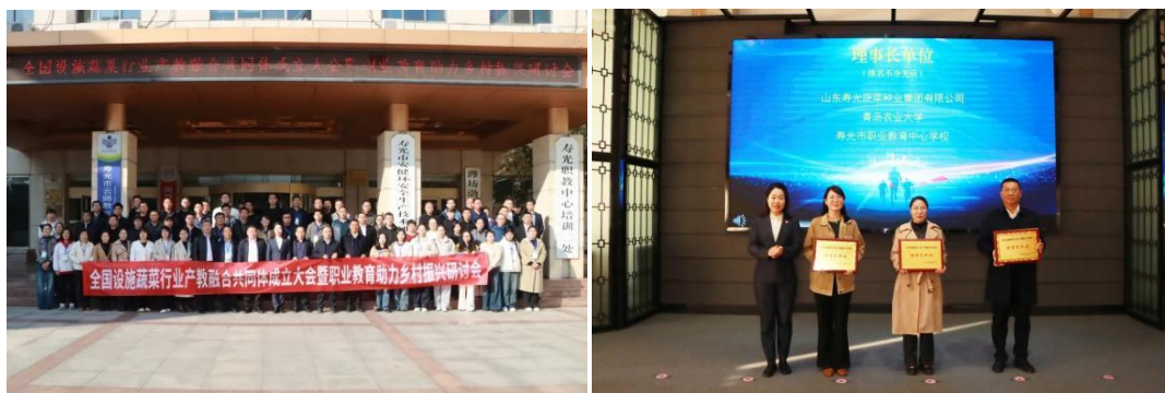
图 4 全国设施蔬菜行业产教融合共同体成立

全国设施蔬菜行业产教融合共同体将集行业企业、职业院校之力，推动政行企校协同，破解制约行业产教深度融合的机制性障碍，同时为各成员单位提供一个合作、交流、创新、发展的平台，进而让职业教育与乡村碰撞出振兴发展的“新火花”。