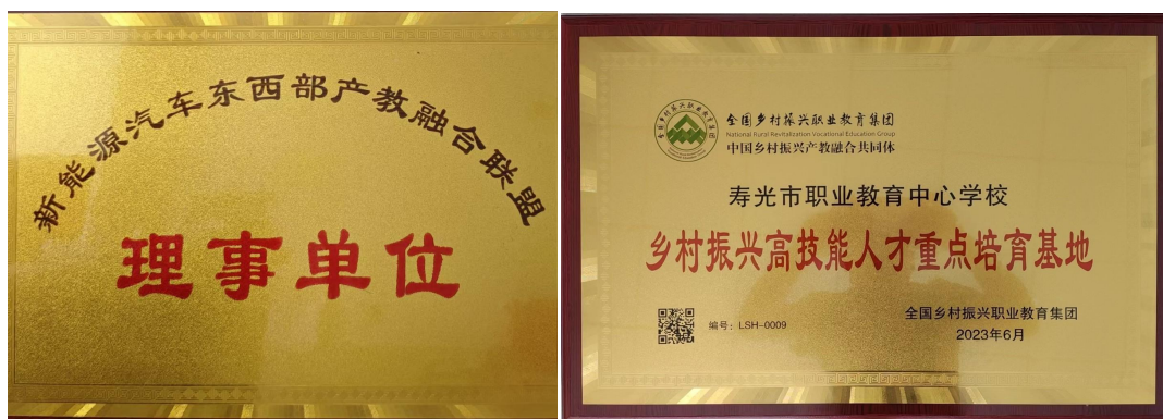
图 7 产教融合开展成果

目一乡村振兴高技能人才重点培育基地”，被认定为“中国交通教育研究会机动车职业教育发展研究中心”副主任单位、“新能源汽车东西部产教融合联盟”理事单位、“全国汽车智能高端装备行业产教融合共同体”理事长单位。这一系列成果不仅推动协同育人模式向更深层次探索，更显著增强了学校社会服务功能，为乡村振兴注入扎实的智力与技能支撑，生动践行了新时代职业教育的担当与社会责任。