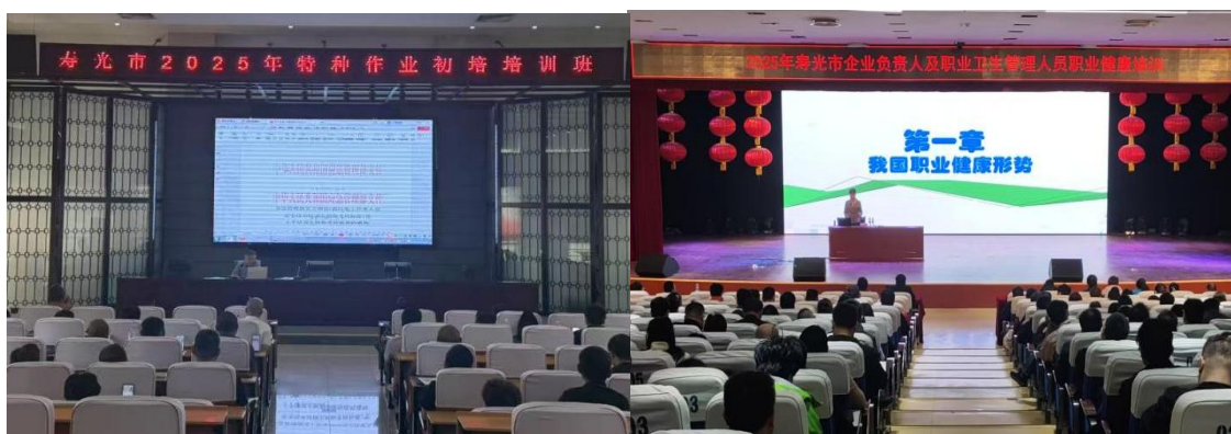
图 3 2025 年社会服务培训

专业安全技术服务：主动为企业及在建工程提供消防安全检查、安全隐患排查、环保检查、安全知识培训等多元化技术服务，服务领域覆盖住建、危险化学品、建材、机械、轻工、商贸等行业，2025 学年服务对象达 100 余家，助力企业消除安全潜在隐患。