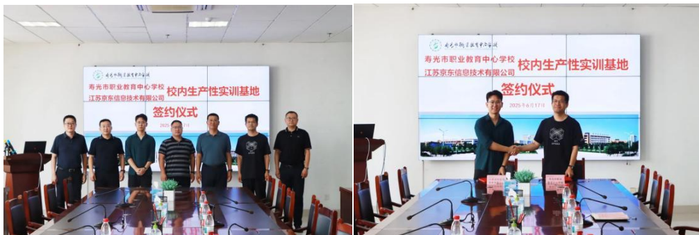
图 8 与江苏京东信息技术有限公司举行校企合作签约仪式

此次校企合作是职业教育与产业升级双向奔赴的关键实践，不仅为学校相关专业发展开辟了崭新机遇，更为电商行业等地方产业升级搭建了优质人才培养平台，将有力推动校企双方实现共赢发展，为行业进步与地方经济发展贡献积极力量。