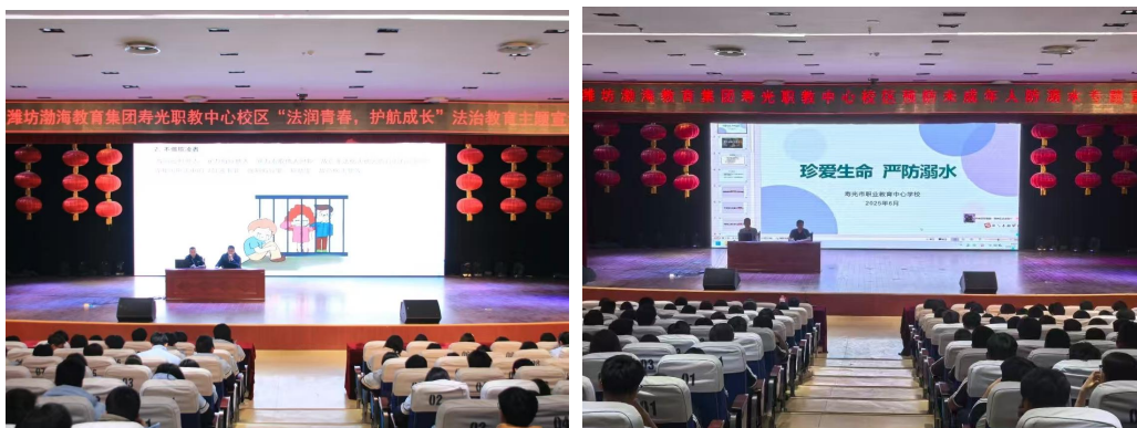
图 11 防溺水、法制教育主题宣讲

五是积极组织师生参加各类安全教育评比活动。在中小学幼儿园安全教育优秀工作案例评选中，获潍坊市 1 等奖；在安全优质课评选中，获潍坊市三等奖；在潍坊市安全教育主题漫画评选中，获 1 个二等奖，1 个三等奖；在中小学安全主题征文评选中，获 1 个二等奖，1 个三等奖；在寿光市国家安全主题征文评选中，获 1 个二等奖，2 个三等奖。