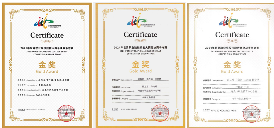
图 9 世界技能大赛获奖证书

2024 年 10 月承办了世界职业院校技能大赛冠军总决赛（中职组）电子与信息赛道一数字产品检测与维护小组争夺赛；2025 年 8 月承办了世界职业院校技能大赛冠军总决赛化工技术赛道（中职 2 组）争夺赛；2024 年 11 月承办了第十七届山东省职业院校职业技能大赛中职组数字产品检测与维护赛项；承办了潍坊市职业院校技能大赛中职组数字产品检测与维护、化学实验技术、化工与环境、企业经营沙盘模拟、现代农艺 5 个赛项的比赛，连续 12 年获“潍坊市职业院校技能大赛十强学校”称号。在 2024 年世界职业院校技能大赛冠军总决赛争夺赛中，数字产品检测与维护、植物嫁接 2 个赛项分别获金奖；在 2025 年世界职业院校技能大赛冠军总决赛争夺赛中，化工技术赛道获金奖 1 项，电子电器与集成电路赛道获铜奖 1 项；在第十七届山东省职业院校技能大赛中，学校参加植物嫁接、电梯保养与维修等 10 个赛项，获一等奖 4 项、二等奖 1 项、三等奖 4 项；在潍坊市职业院校技能大赛中职组比赛中，学校参加 18 个赛项，获一等奖 7 项、二等奖 25 项、三等奖 42 项；在 2024 年潍坊市职业技能大赛中，山东省寿光市技工学校获“突出贡献单位”，7 人被评为“优秀选手”、2 人被评为“优秀指导教师”、2 人被评为“优秀裁判员”。